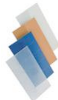
Okklusivfolien zum Selbstzuschneiden

Hat der Patient infolge einer angeborenen oder erworbenen Augenerkrankung (z. B. Sehschwäche (Amblyopie), organische Veränderung) eine Sehminderung eines Auges, so kann ggf. auch das sehschwächere Auge okkludiert werden, obwohl es das bewegungsfreie, nicht gelähmte Auge ist.