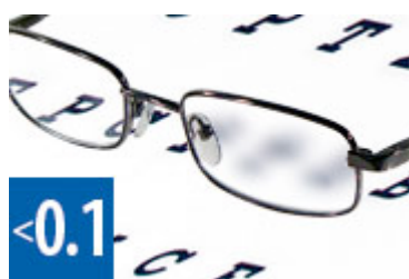
Okklusivfolie, die nur noch eine Sehschärfe von ca. 10% zulässt

Die Okklusion im Erwachsenenalter muss NICHT gewechselt werden. Es besteht keine Gefahr mehr für eine Sehschärfenminderung infolge längerer Okklusionszeit, da das Sehsystem bereits im Kindesalter vollständig ausgereift ist. Das Fehlen des Seheindrucks durch längeres Abdecken des gelähmten Auges hat keinen Einfluss auf die Spontanheilung, denn es bekommt auch unter der Okklusion ausreichende Bewegungsimpulse. Und das offene Auge erfährt keine Überanstrengung.